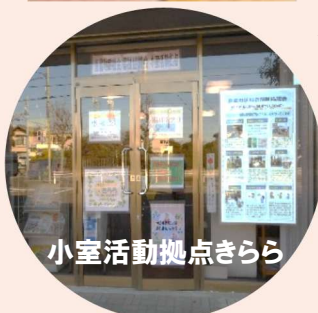
小室活動拠点きらら

〒270-1417 船橋市小室町 3060-3 TEL.047-457-7718