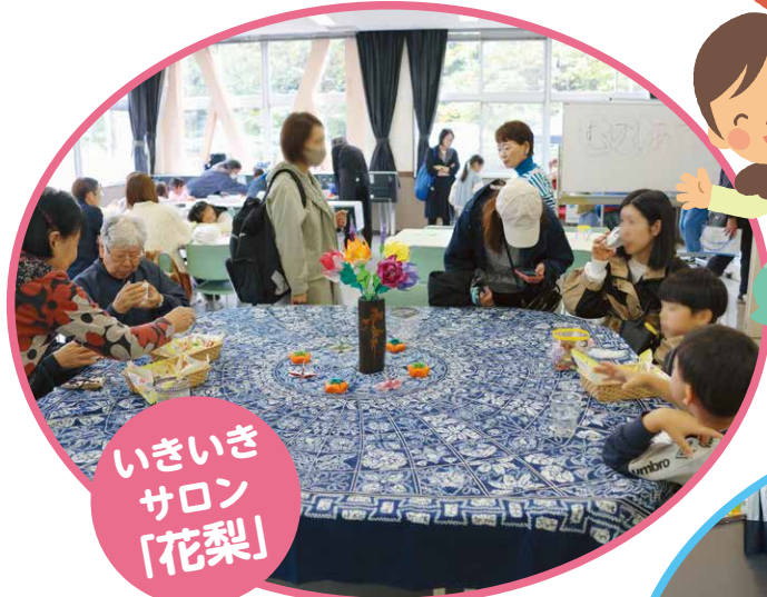
いきいき サロン 「花梨」