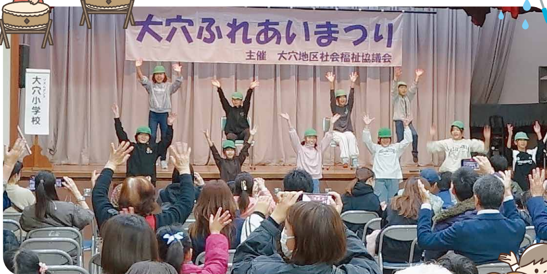
大穴小学校5年生によるリズムダンス