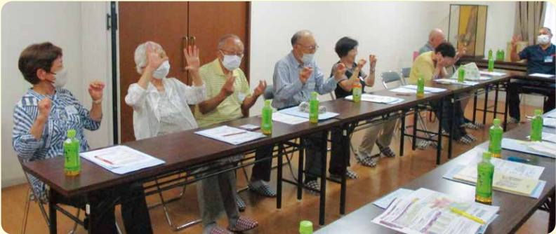
高齢者と一緒にゲームなどします