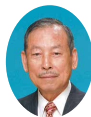
大穴地区社会福祉協議会

地域福祉は共助（共に助け合う）で成り立っています。地域の繋がりが希薄になれば犯罪や災害時に、助け合うことも難しくなります。最近では生活上での人と「ふれあう」ことも少なくなりました。私事ですが先日、最近出来たファミレスに入りました。入店から食事と会計まで済ませ、店を出るまで店員さんの案内も無く、会話もないまま目的は果たせました。今