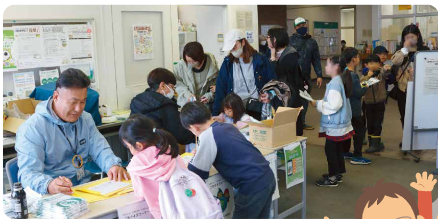
530(ゴミゼロ)クイズに参加