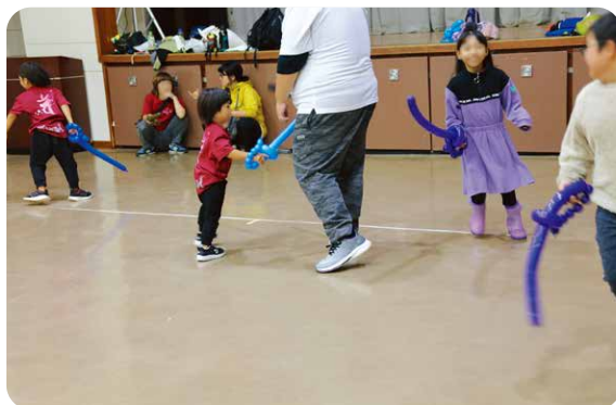
ペンシルバルーン