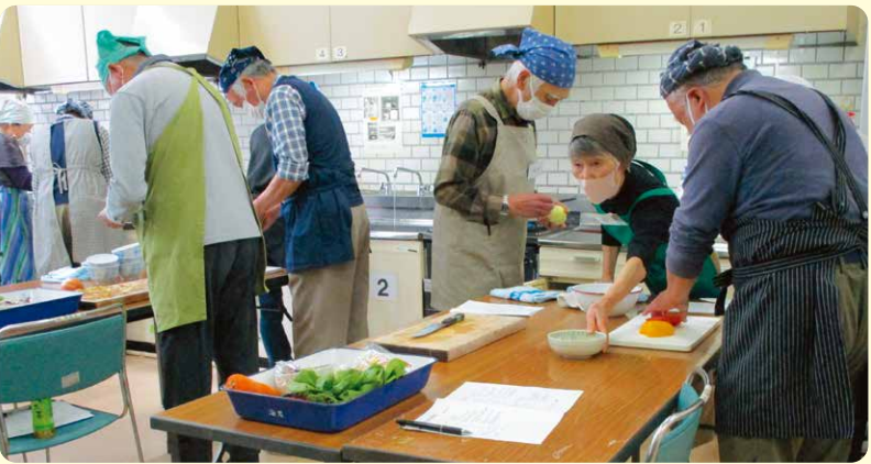
参加者が作る料理のお手伝いとと一緒に料理をいただきます