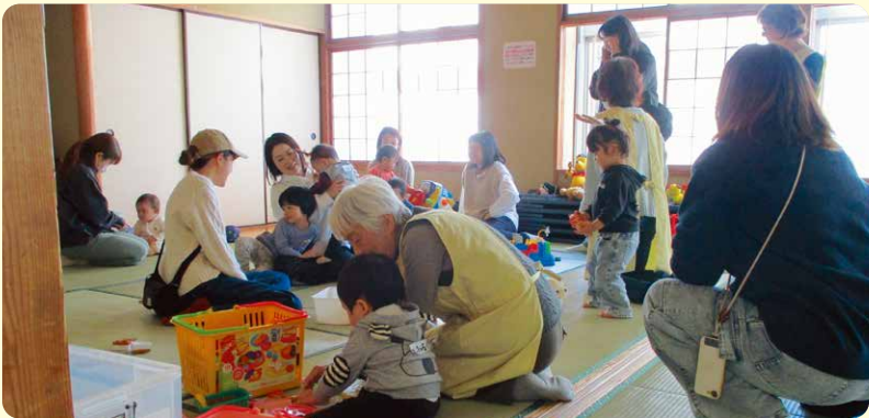
未就園児親子の交流やお子様の遊び相手