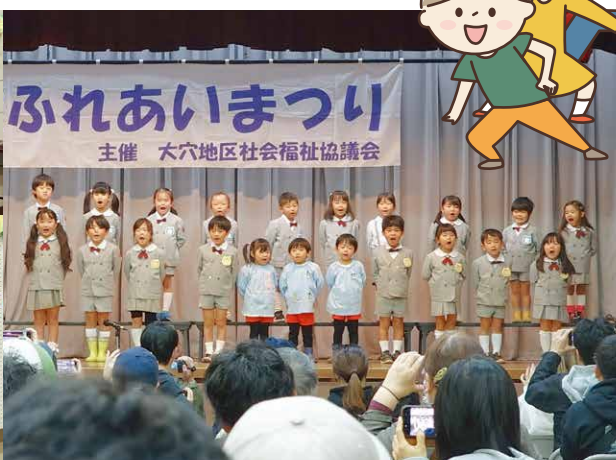
すずみ幼稚園児による絵と合唱