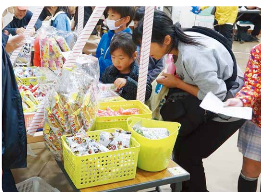
昔あそびコーナーのスタンプラリーでお菓子をゲット!