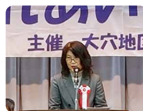
地域福祉課 忍足課長の挨拶