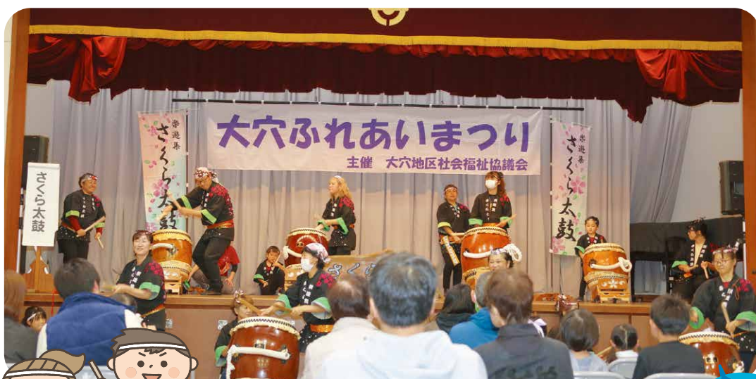
さくら太鼓の演奏