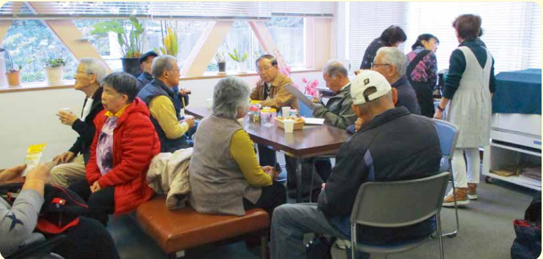
高齢者とお茶を楽しみながらおしゃべりをします