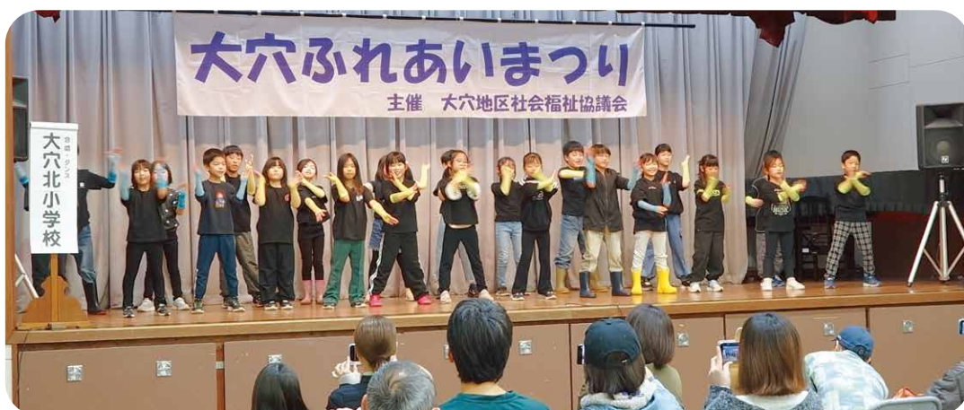
大穴北小学校2年生による合唱とダンス