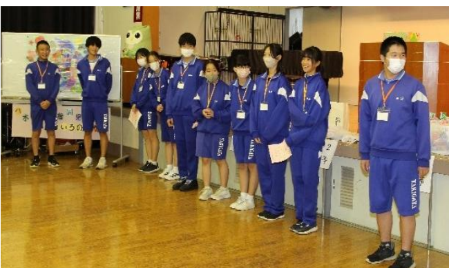
今年も大活躍八木が谷中学校のみなさん