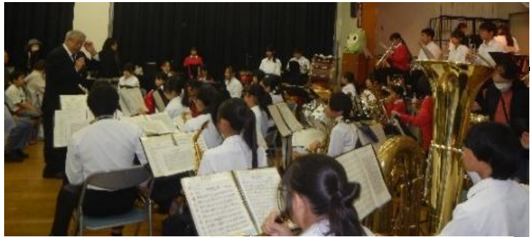
八木が谷中・八木が谷北小によるコーロ演奏

日頃より、地域の皆様に は八木が谷地区社会福祉協 議会の活動にご理解ご協力 を賜り心より御礼申し上げ ます。 去る十月十一日、八木が 谷公民館で八木が谷地区 「福祉まつり」を開催しまし た。あいにくの雨にもかか わらず大勢の方にご来場を 頂きました。 公民館全体で子供から年配 の方まで笑顔で会話する光 景を見ることが出来ました。 さらに船橋東警察署のご協 力でパトカーと移動交番の 展示、防犯講話が行われ、最 近の詐欺被害など地域の安 全について学ぶ機会になり ました。