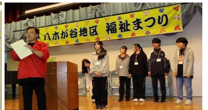
船橋北高等学校美術部 & 家庭科部の皆さん