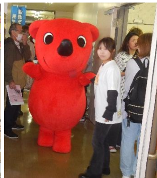
雨にも負けず力を合わせて呼込み！