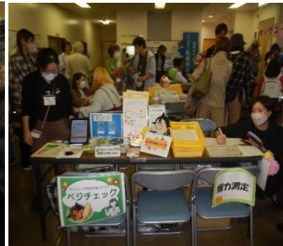
ベジチェック(野菜摂取量測定)