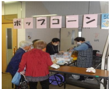
ポップコーンも大盛況！