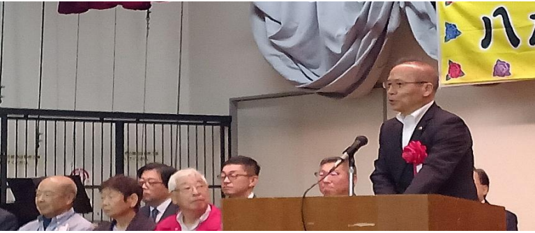
開会式にて市長がご挨拶

八木が谷地区社会福祉協議会 発行責任者（編集：広報部） 〒274-0802八木が谷2-14-6 八木が谷公民館内 ☎ & Fax 047-448-7713 E-mail:yakigaya-shakyo@dream.jp 月曜日～金曜日（祝日・公民館休館日は休み） 午前10時～12時 午後1時～3時