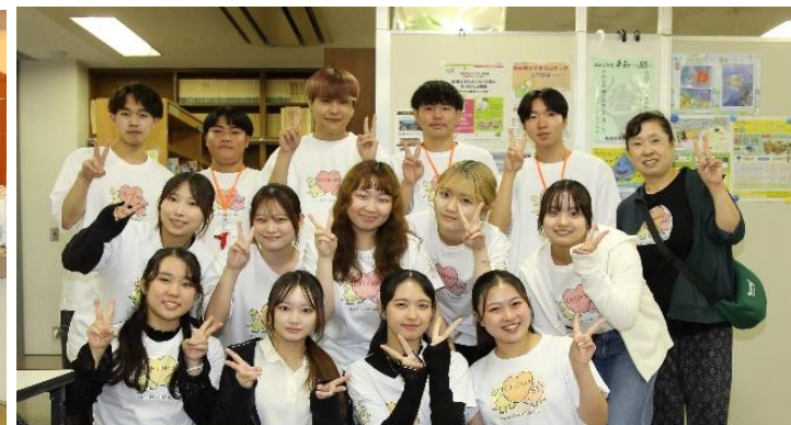
東京医療保健大学は笑顔が素敵な人ばかり