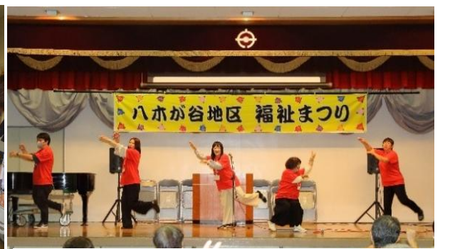
フラミンゴによるロコモ体操