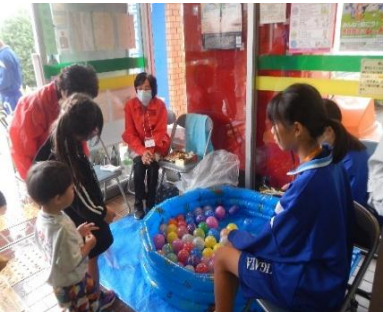
小さい子に人気のヨーヨー

開催にあたっては、地域ボラン ティア、協力団体や、八木が谷 中学校、船橋北高等学校、東京 医療保健大学の学生ボラン ティアなど総勢一七三人の 皆様の協力を頂きました。 学生たちが運営を支えなが ら異世代の皆さんと協力し、 交流の大切さ、集いの楽し さを感じて成長してくれる と思います。「福祉まつり」が 次世代に引き継いだ貴重な 体験の場として、また地域 の皆様の笑顔あふれる交流 の輪が広がるよう、住みよ い町作りに取り組んでまい ります。 これからも変わらぬご支援 とご協力の程宜しくお願い 申し上げます。