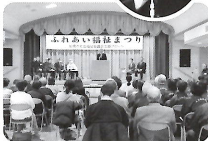
開会式 松戸徹市長のご挨拶

令和6年度の共同事業は当番を松が丘地区と大穴地区が合同で務め、1月31日(金)に松が丘公民館において開催し、北部ブロック7地区社協より83名が参加、うち大穴地区からは17名が参加しました。