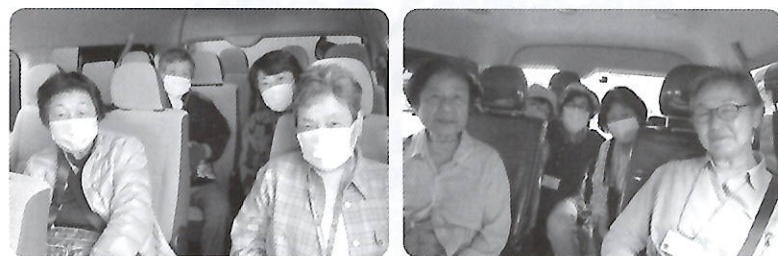
買い物送迎サービスの車中

社会福祉法人修央会(軽費老人ホーム 福寿荘) 医療法人徳洲会(介護老人保健施設 千葉徳洲苑)