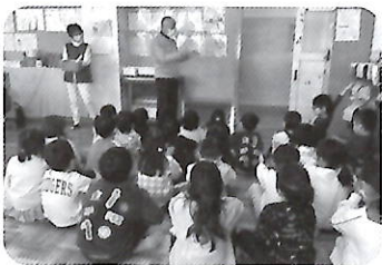
紙トンボ 飛ばし方の説明

紙トンボは飛ばし方の工夫で紙で作った羽根の部分をひねったりするとところがちょっと難しかったようです。こまは児童が銘々所有しており、上手に回す子もいて驚かされました。あやとりも中には1人あやとりや2人あやとりなどもできる子がいて忘れかけている私達が教えられる部分もありました。