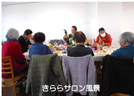
きららサロン風景