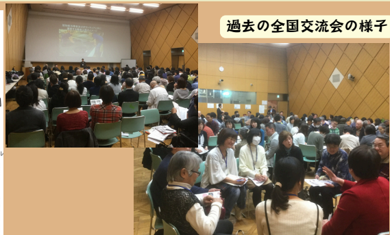
過去の全国交流会の様子