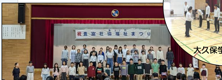
フィナーレ小室小学校の合唱