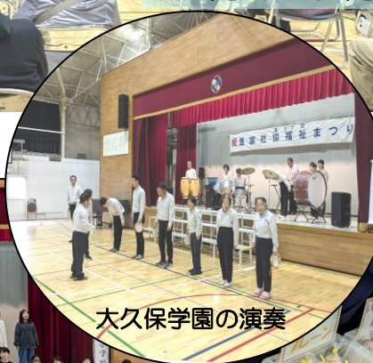
大久保学園の演奏