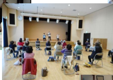
シルバーリハビリ体操