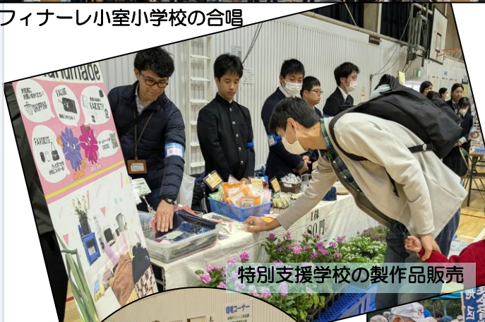
特別支援学校の製作品販売