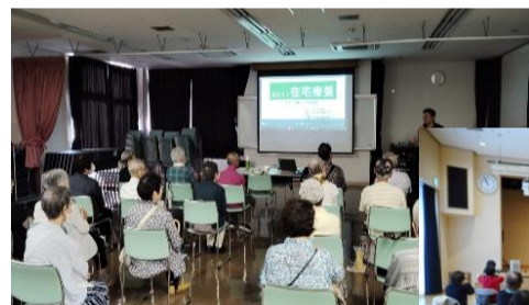
ボランティア育成講座