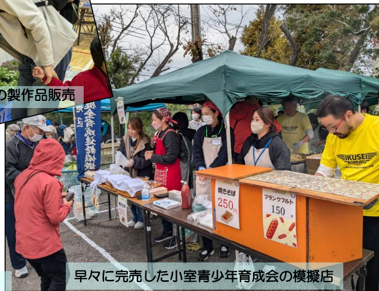
早々に完売した小室青少年育成会の模擬店