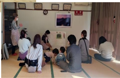
子育てサロンつくしんぼ