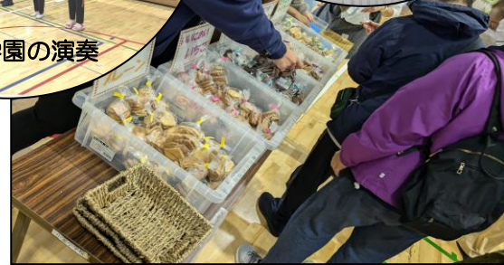
大盛況の小室小学校クッキーの模擬店