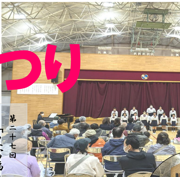
豊富小学校音楽部合唱

昨年十一月、小室小学校において第二十七回福祉まつりを開催いたしました。千五百人を超える多くの方に足を運んでいただき、「集う」事の喜びや楽しさを感じていただけたのではないのでしょうか。