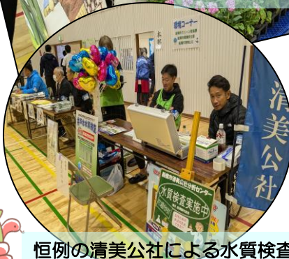
恒例の清美公社による水質検査