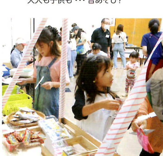
昔あそびのスタンプラリーでお菓子をゲット!