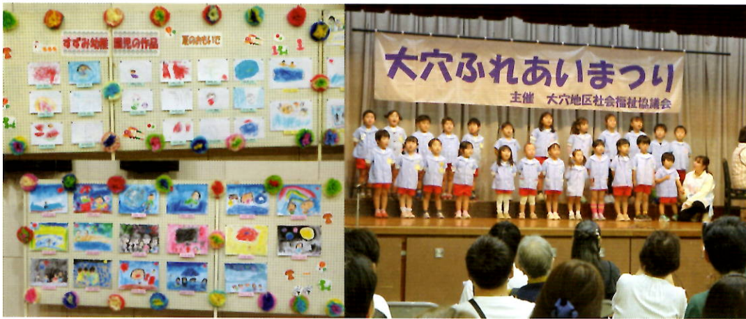
「夏のおもいで」すずみ幼稚園の絵と合唱