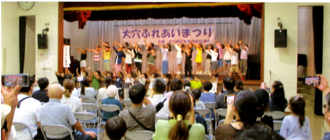
素晴らしい! 大穴北小のみなさん