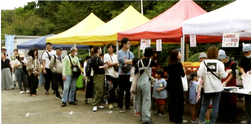
楽しい楽しい!! みんな大はしゃぎ