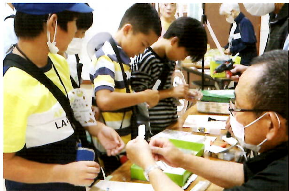
紙とんぼ作るぞー!