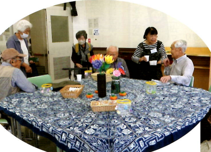
いきいきサロン「花梨」でひと休み