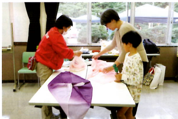
赤十字コーナー 風呂敷を使ってリュック作り