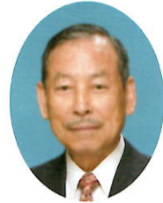
大穴地区社会福祉協議会

こんにちは、大穴地区社会福祉協議会「大穴地区社協」です。広報紙発行に当たりご挨拶申し上げます。いつも地域の皆様には大変お世話になっておりますこと御礼を申し上げます。