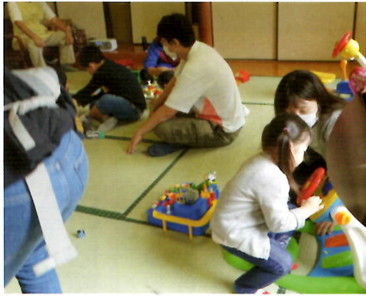
子育てプレイルーム