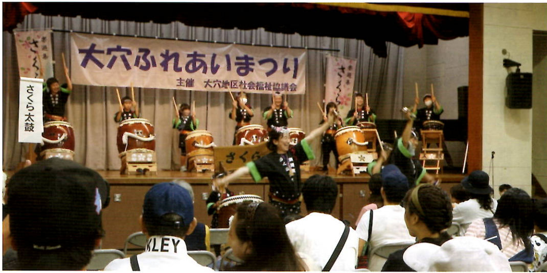
まつりを祝う さくら太鼓が響き渡る