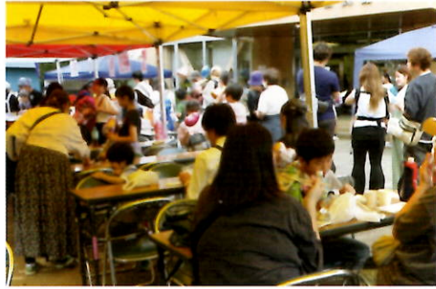
お友だちとお食事