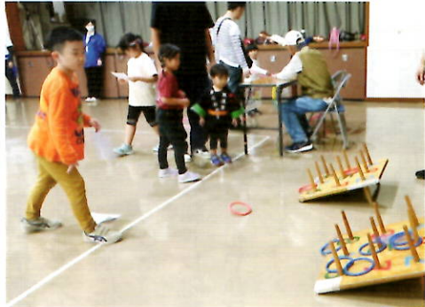
大人も子供も・・・昔あそび?