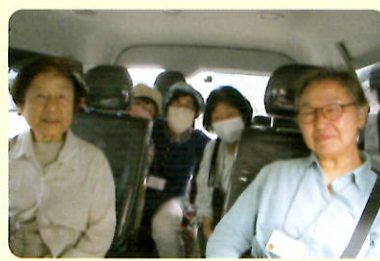
買い物送迎サービスの車中

社会福祉法人修央会(軽費老人ホーム 福寿荘) 医療法人徳洲会(介護老人保健施設 千葉徳洲苑)