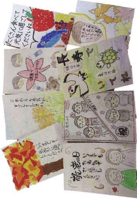
児童・生徒が描いた「絵手紙」

児童、生徒の皆さんが描いた絵手紙には、「今年の夏はとても暑かったですね。体調は大丈夫ですか？いつも地域で私たちを見守り、支えてくださりありがとうございます。」「詐欺にだまされたくないで！」など、受け取る方を気づかうお手紙やちぎり絵など、気持ちがたくさん込められた作品でした。