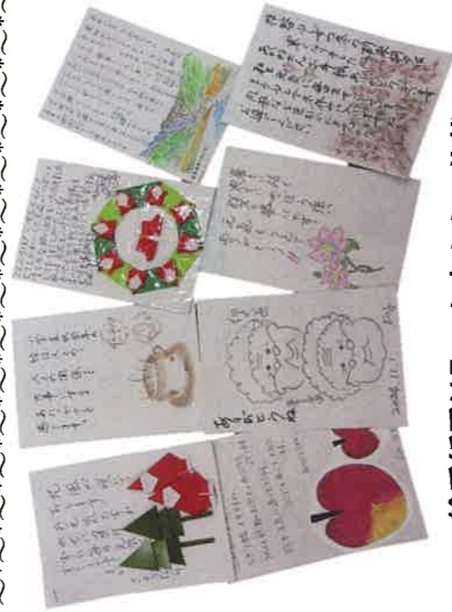
絵手紙受け取った方からの礼状

送る方も受け取る方もお互い顔はわかりませんが、相手を思う気持ちは伝わることを改めて実感しました。お預かりしたお返事は各学校へ届けました。返事を受け取った児童・生徒からもお礼の声が届いています。ご協力いただいた皆様に感謝申し上げます。