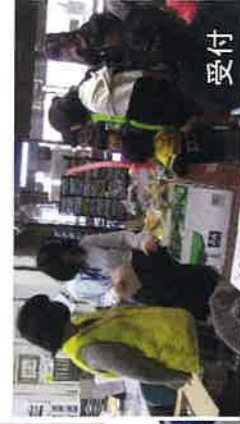
東邦大ボランティア