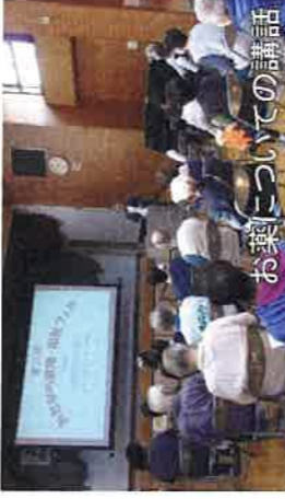
お薬についての講話