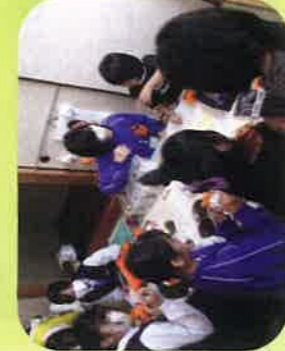
みたなら健康・福祉フェア

今年も多くの学生がボランティアとして、事業に参加してくれました。何もかもが初めてづくしで、緊張しながらもみなさん活動していました。夏休みには中学生9名・高校生6名・大学生3名がすこやか広場、ミニデイサービス、ワークキット作成に参加してくれました。「子供を地域で育てるということがボランティアを通じて知ることができた。」「小さい頃、ワークキットをもらっていたが、自分が体験して、かくれた善意に気づくことができた。」と感想を聞くことができました。