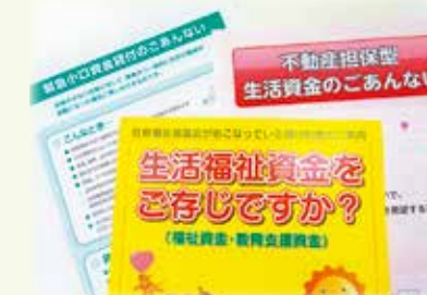
生活福祉資金のパンフレット