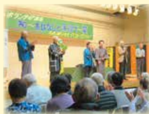
ボランティア講座

地域の福祉力を高めるため、ボランティア活動を行うための研修や講座を実施し、新たな担い手の発掘やボランティアのスキルアップを図る事業です。