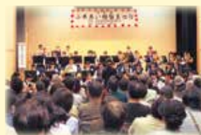
近隣学校による演奏

地域の人たちや関係機関・団体等との交流を通じて、地区社協や地域福祉の大切さを広めるとともに福祉への関心を深めてもらう地域密着のおまつりです。