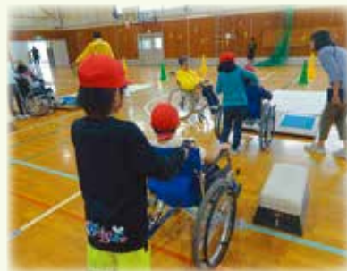
小学校での福祉教育