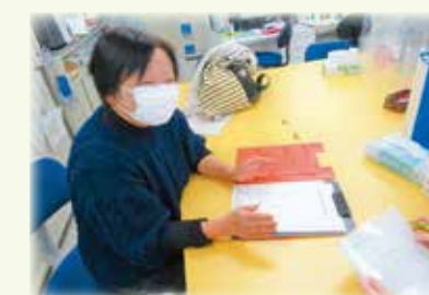
訪問、支援を行う生活支援員