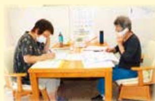
電話による見守り活動

登録者への日常的な見守り活動（訪問・電話・はがき・防災訓練等）を通じ、緊急時や災害時において、地域の皆様方（地区連絡協議会〔町会・自治会〕や民生委員・児童委員などの支援により、安否確認や避難支援にできる限り迅速かつ適切につなげることを目的としています。