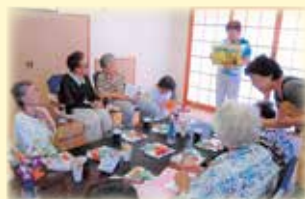
紙芝居の読みきかせ

高齢者をはじめ、障がいのある方、子どもたちなど、地域の人たちの誰もが参加でき、参加者自身が企画する趣味やレクリエーション（ゲームなど）を通じて世代を超えた仲間づくりの場を提供しています。