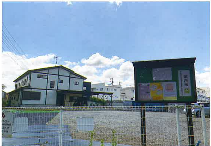
二和地区社会福祉協議会 分室なごみ