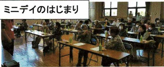
ミニデイのはじまり