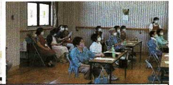
※ 演芸は皆さんと一緒に