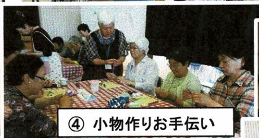
④ 小物作りお手伝い