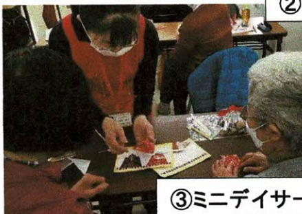
③ミニデイサービスでの工作指導