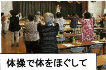
体操で体をほぐして