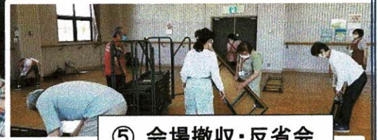
⑤ 会場撤収・反省会