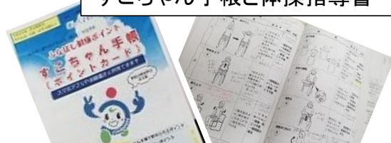
すこちゃん手帳と体操指導書