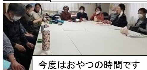
今度はおやつの時間です