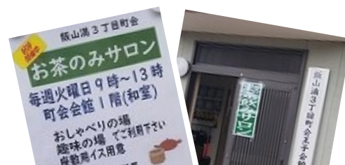
茶のみサロン案内と会場

今後とも、二宮・飯山満地区で”「集いの場」”を広げて行けるよう、皆様のご理解とご協力を宜しくお願いします。