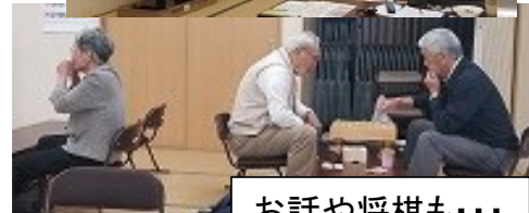
お話や将棋も・・・