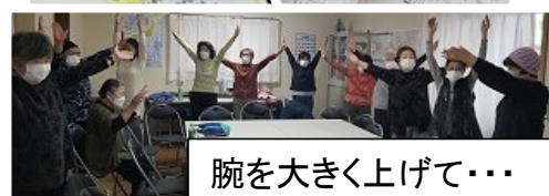
腕を大きく上げて・・・