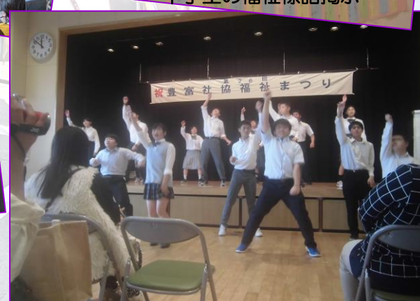
特別支援学校の息の合ったダンス