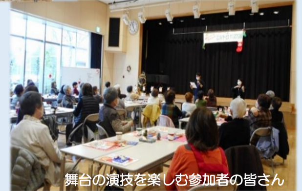
舞台の演技を楽しむ参加者の皆さん

健康チェック、体操、小物作り、アトラクションなど行っています。お弁当を用意してお待ちしています。(参加条件があります)