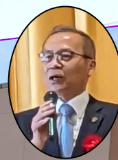
松戸市長のあいさつ