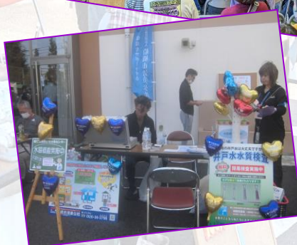
好評の清美公社による水質検査