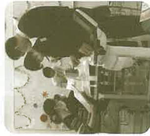
【東部保健センター・薬園台在宅介護支援センター】