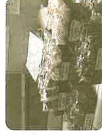
【ロングライフパン販売】