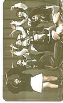
【薬園台高校 ダンス同好会】