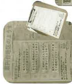
【生活支援コーナ-】 来場者にクイズに参加してもらいました