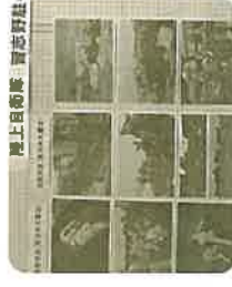
【陸上自衛隊習志野駐屯地】