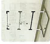
【軽スポーツ・ラダーゲッター】