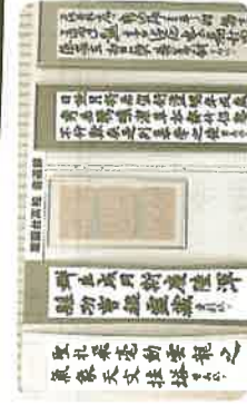
【薬園台高校 書道部】