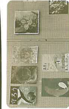
【薬園台高校 美術部】