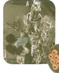
【手作りの品・お団子販売】