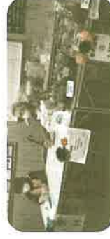
【受付・多肉植物販売】